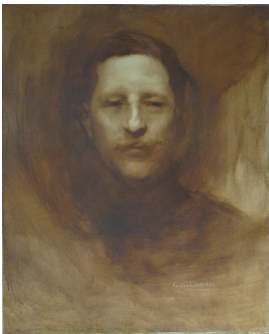
Portrait de Georges Picquart , huile sur toile, 1902,