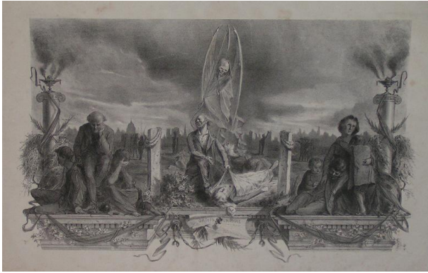
Les Droits de l'Homme , lithographie, 1871,